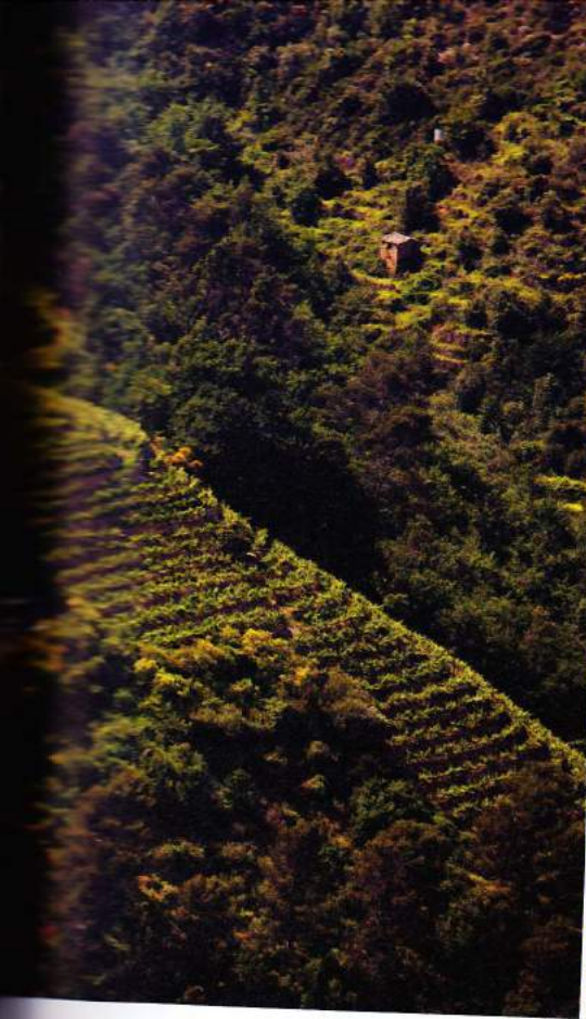
Crù Pini (Gemeinde Soldano) unten: Die Reben wachsen vor wunderschöner Bergkulisse